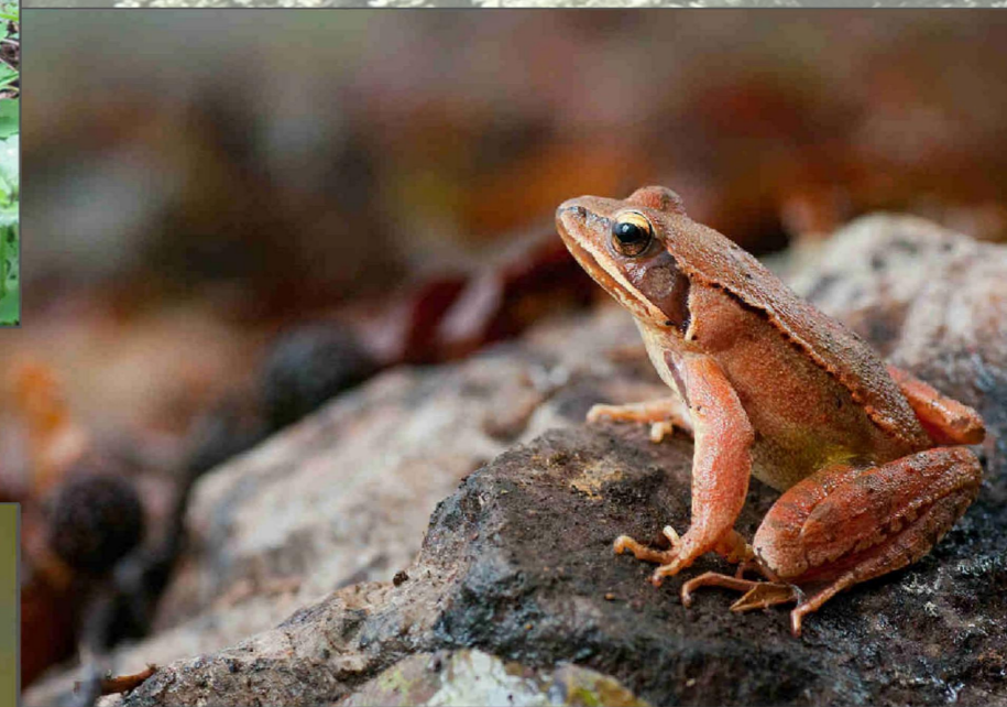
Rana dalmatina fitzinger (Rana agile).

A sottolineare il valore della zona, sono state trovate numerose specie faunistiche e floreali tipiche di questo habitat, alcune delle quali anche a serio rischio d'estinzione come l'uccello Piro piro piccolo ( Actitis hypoleucos ) o l'erbacea Gigaro chiaro ( Arum italicum ), a causa della crescente pressione dell'attività umana.