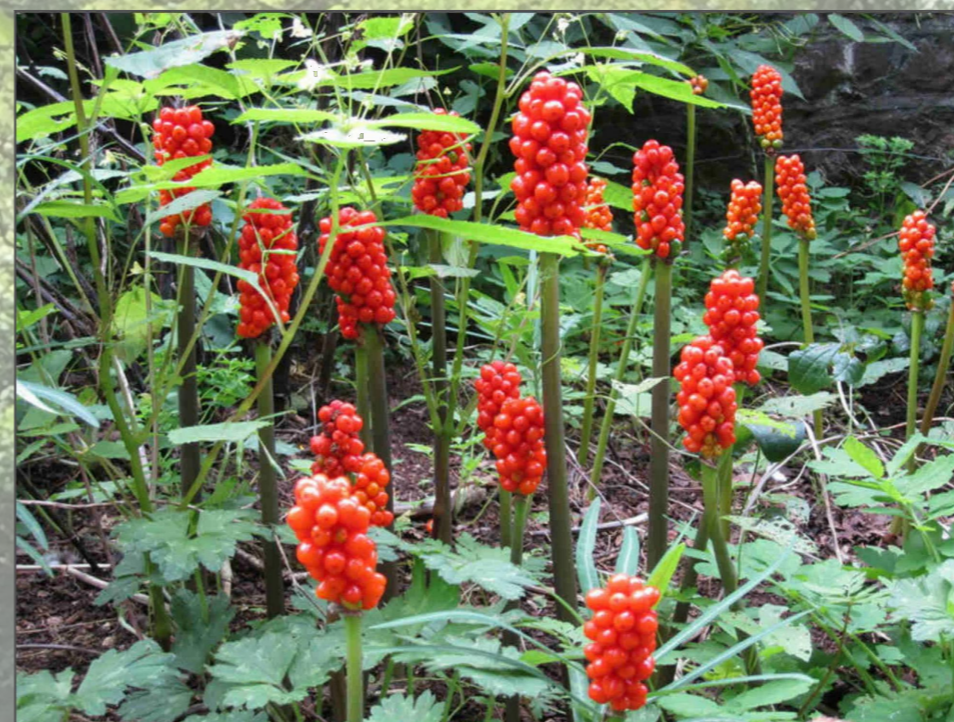
Arum italicum (Gigaro chiaro).

Zona di transizione, a cavallo tra il fiume, il lago e la terraferma, la continua azione modellante dell'acqua, unita ai fenomeni di erosione e di deposito, ha permesso la creazione di una grande varietà di ambienti golenali, ripariali, forestali, ecotonali e prativi, di pregio ecologico per tutto il bacino lacustre. Il delta della Magliasina, oltre a caratterizzare un paesaggio naturale di grande valore, ospita una flora e una fauna specializzate e rare, che dipendono direttamente dai fenomeni naturali di inondazione e dalle escursioni della falda freatica.