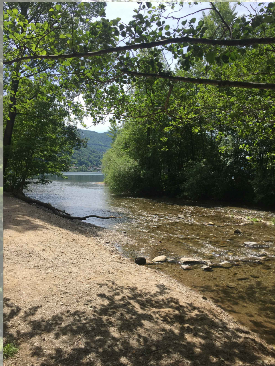
La foce della Magliasina.

Zona di transizione, a cavallo tra il fiume, il lago e la terraferma, la continua azione modellante dell'acqua, unita ai fenomeni di erosione e di deposito, ha permesso la creazione di una grande varietà di ambienti golenali, ripariali, forestali, ecotonali e prativi, di pregio ecologico per tutto il bacino lacustre. Il delta della Magliasina, oltre a caratterizzare un paesaggio naturale di grande valore, ospita una flora e una fauna specializzate e rare, che dipendono direttamente dai fenomeni naturali di inondazione e dalle escursioni della falda freatica.