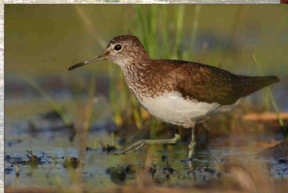
Actitis hypoleucos (Piro piro piccolo).

Tra gli anfibi, è stata trovata la Rana agile ( Rana dalmatina fitzinger ), specie molto rara a livello svizzero; mentre tra le specie ittiche fortemente minacciate la Trota di lago ( Salmo trutta lacustris ).